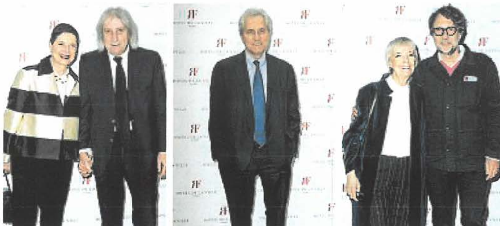
Isabella Rossellini ed Enrico Vanzina